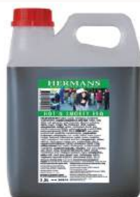
BBQ SÅS HOT'N SMOKEY 2,5 liter/st