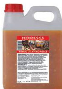
MANGO- & JALAPEÑOGLACE 2,5 liter/st