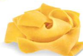
PASTA PAPPARDELLE BACCHINI

Fryst 08119 Italien 1,5 kg/krt 69.00 kr/kg