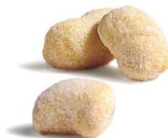
PASTA GNOCCHETTI PATATA BACCHINI

Fryst 08119 Italien 1,5 kg/krt 69.00 kr/kg