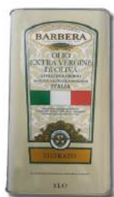
OLIVOLJA BARBERA EXTRA VERGINE 3 liter/st