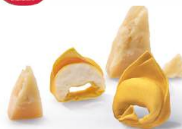
BALANZONE AL PARMIGIANO REGGIANO D.O.P. DIVINE CREAZIONI Med parmesan- och ricottaost

Fryst 08125 Italien 2 kg/krt 196.00 kr/kg